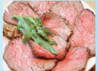
豪州産ローストビーフ 880円