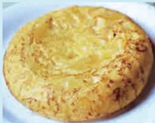
スペインオムレツ 780円