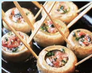
マッシュルームの鉄板焼き 680円