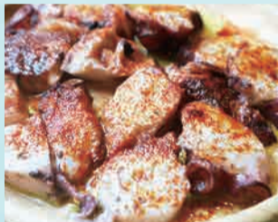
タコのガリシア風 880円