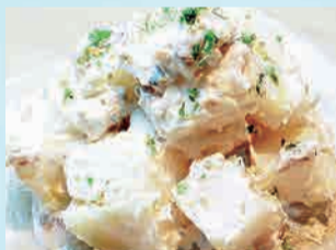
アンチョビポテト 480円