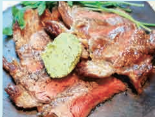
豪州産サーロインステーキ 1,280円