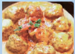
ミートボール (ブルーチーズソース) 880円