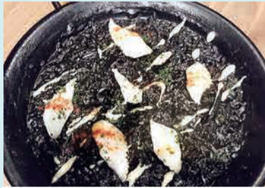
イカ墨のパエリア 1,980円