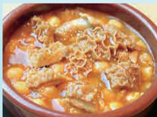
カジョス (トリッパの煮込み) 380円