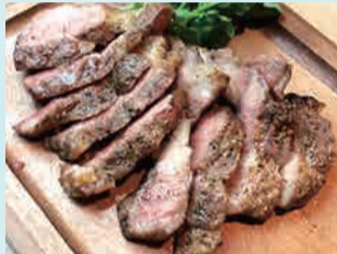
イベリコ豚 肩ロースのグリル 1,280円