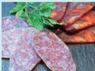
スペイン産サラミの盛り合わせ 480円