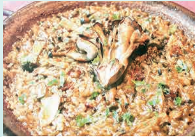
きのこのパエリア 1,890円