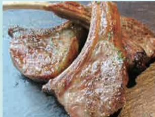
ラムチョップのグリル 1本480円