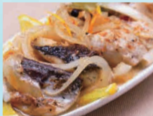
サバのエスカベッシュ 580円