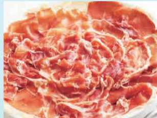
お皿いっぱい生ハム 880円