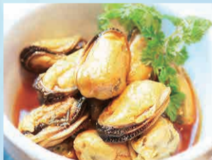
ムール貝のオイル煮 380円