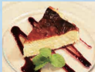
バスクの黒いチーズケーキ 580円