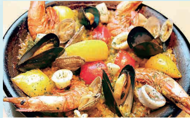
魚介のパエリア 1,980円