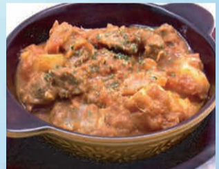
仔羊のトマト煮込み 880円