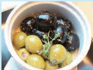
スペイン産オリーブ2種盛 380円