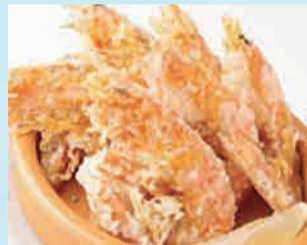
海老の塩フリット 780円