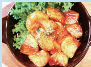
インカの目覚めのポテトフライ (パタスプラバス) 780円